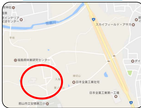
きのご振興センター