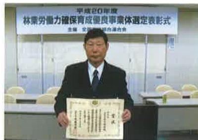
(有)平子商店 平子社長

(有)平子商店では、林業後継者を育成するため積極的に若いI・Uターン者を採用し、各種研修会に参加させ技術の向上に努めるとともに、I・Uターン者の地域への定着を促進するため社宅を建築し、雇用者の定住環境の整備に努めています。さらに、労災保険・雇用保険等の社会保険や厚生年金・中退共に加入し、福利厚生を充実させています。若い林業後継者が多いことから、「危険0により、事故0」を目指して、安全衛生教育の徹底を図っています。毎週月曜日に全体安全会議を開催し、林災防等から提供のあった最近の事故を分析し類似事故の防止を図るほか、前週にあったヒヤリハット、今週の各自の安全目標等を発表しています。さらに、現場が変