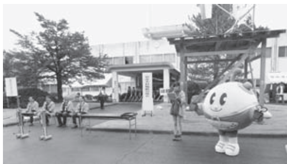
▲開会式 植樹祭バージョンキビタンも登場