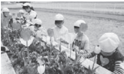
花壇を整備している様子 (会津若松市立大戸小学校)