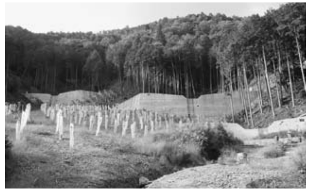
丹波市市島地区の折り曲げた堰堤と鹿食害防止対策（苗に網をかけている）

視察しました。現場は、崖に近い急傾斜となっており、相当の難工事であると実感させられました。