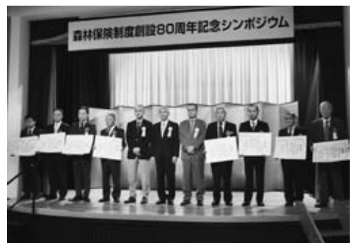
森林保険センター所長感謝状授与者

下で、現在の「森林保険」業務が開 始されました。 しかしながら、木材価格の低迷、森林に対する関心離れ等により、森林保険の加入率が年々減ってきていることなどから、継続契約者においても継続契約が可能になるなど、サービス向上のために保険制度を見直した、改定保険制度が、平成三二年四月から開始されます。 近年、局地的に極めて大量の降雨が観測されたり、台風の進路が変化し今までとは違う地域が直撃されたりすることが目立ってきており、それに伴い甚大な森林被害が発生しております。 万が一の被害に備えて、皆様の大切な財産を守る「森林保険」へ是非ご加入ください。