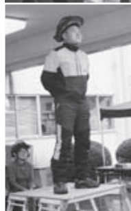
◀▲林業担い手の主張 出演者の皆さん