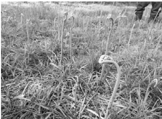
収穫・出荷が待ち遠しいです

季節を感じる事ができる山菜やきのこは、地元の直売所では人気の商品であり、出荷制限等の解除に向けた取組は、急務の課題の一つとなっています。このため、いわき市、直売所、生産者団体等と連携を図りながら、ひとつでも多くの品目の出荷制限が解除できるよう、取組を続けていきます。