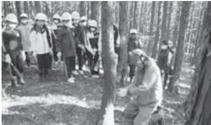
学校林での学習の様子 (いわき立田人中学校)