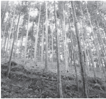
間伐部門県知事賞の森林

森林の状況が保育期から利用期に移ってきていることから、林業コンクールについても時代の要請に応えられるよう見直しを図りながら、林業経営者の方々の奮起材料となれるよう、これからも開催してまいります。