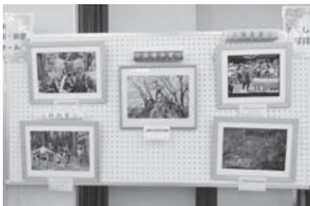
第42回福島県林業祭で展示