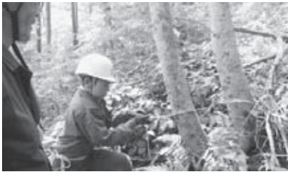
学校林での学習の様子 (会津若松市立湊小学校)

「猪苗代湖の水質調査」をテーマに、水源地の学校林の整備を通して、猪苗代湖のきれいな水を生み出している森林の有する水源涵養や水質浄化等の機能について学んでいます。