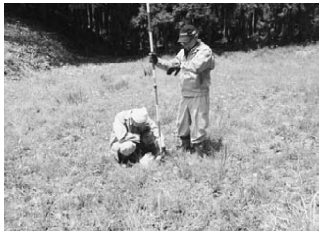
わらびほ場の空間線量調査中です