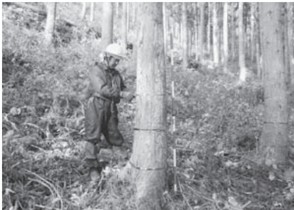
クマ剥ぎ対策のテープ巻き

緩衝帯整備と併せ、クマ剥ぎを防止するためのテープ巻きを実施している箇所もあります。樹木の下方に何周かテープを巻き付けることにより、物理的に樹皮が剥がれるのを防ぐことに加え、クマが異物を嫌がることによる防除効果も期待されます。