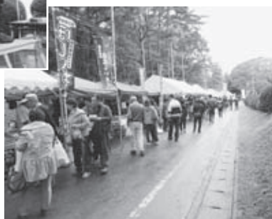
▲雨の中でもたくさんの方に 御来場いただきました