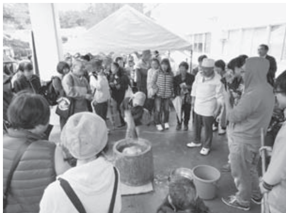
▼とち餅つき実演・試食会