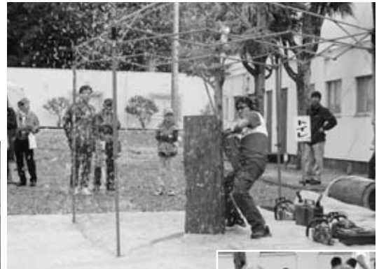
▲チェーンソーアートショー