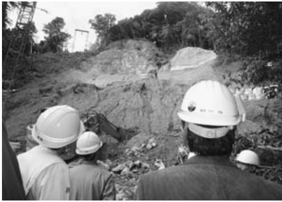
有馬温泉地内の落葉山地区

近年、局地的集中豪雨等により、特定の区域だけに甚大な被害をもたらす自然災害が増えていることから、これらの被災からの復興状況を視察研修するため、今年度は十月三〇日から三二日にかけて十一名が参加し、兵庫県で研修会を実施しました。