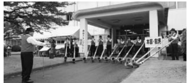
▼森のコンサート 21日