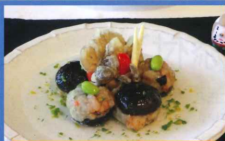
愛LOVE福島 しいたけ うまか まんじゅう!