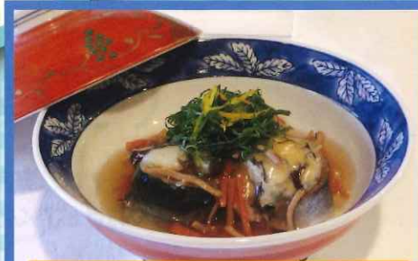
きのごたっぷり さんまのけんちん蒸し ~いかに人参あんかけ~