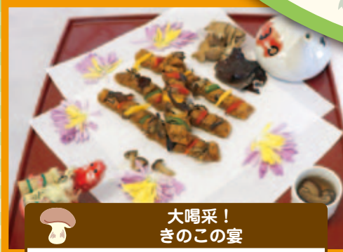
大唄采! きのこの宴