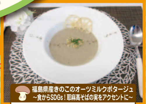
福島県産きのこのオーツミルクポタージュ ~食からSDGs! 耶麻高そばの美をアクセントに~