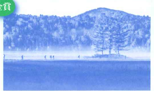
「早朝の光に」 泉田実