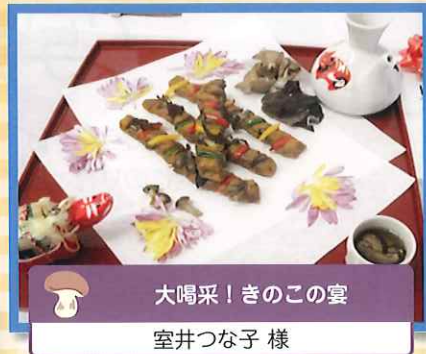
大喝采！きのごの宴 室井つな子 様 (第6回福島県きのご料理コンクール県知事賞受賞作品)