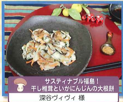
サスティナブル福島！ 干し椎茸といかにんじんの大根餅 深谷ヴィヴィ 様 (第7回福島県きのご料理コンクール県知事賞受賞作品)