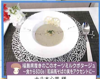
福島県産きのごのオーツミルクポタージュ ～食からSDGs！耶麻高そばの実をアクセントに～ 大八木心美 様 (第6回福島県きのご料理コンクール県知事賞受賞作品)