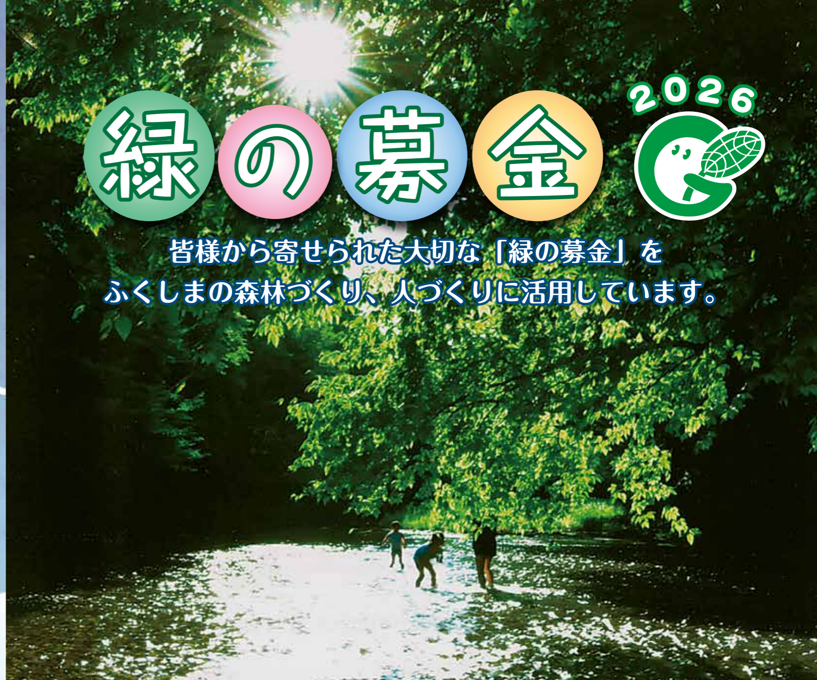
第40回ふくしま緑の写真コンクール作品「煌めく共演」 撮影地:西郷村 西郷滯

皆様から寄せられた大切な「緑の募金」を ふくしまの森林づくり、人づくりに活用しています。